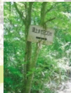
あと残り 200 m。もう少しで山頂です