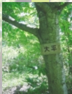
【大平】約 1 時間で到着。急な坂はこれから