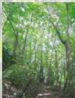
クヌギの林が続きます