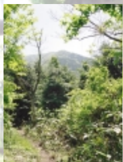
少し景色が開けてきます