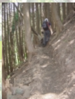
急勾配の坂道。ゆっくり歩こう