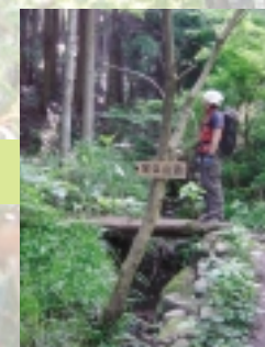
歴史民俗資料館の横道を登っていきます