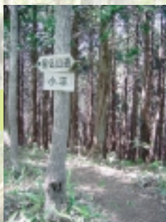
【小平】約 40 分で到着。一休みしてみてもいい？