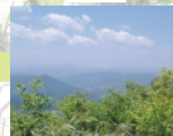
山頂からの大パノラマは絶景。この景色が見たい