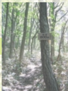
標高 800 m に到達