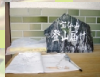
登山する時は、登山届けに記入してから