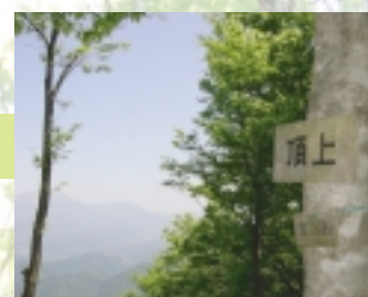
やっと山頂に到着。ゆっくりと休みましょう