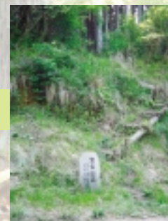
【登山道道標】第 1 ポイント。これからです