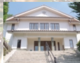
登山道入口の歴史民俗資料館。ここから出発