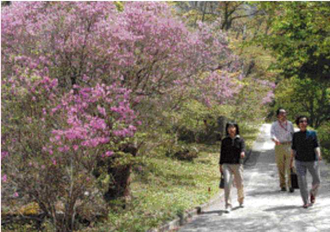
花を愛でながら散策を楽しむ

桜・つつじの名所として有名な公園内には、ダイセンミツバつつじが約3万本、遅咲きの八重桜が約100本あり、山肌によって咲き誇る姿は、さながらピンク色のじゅうたんを敷きつめたよう。今年は何年に比べ約1週間ほど見ごろが遅く、ま