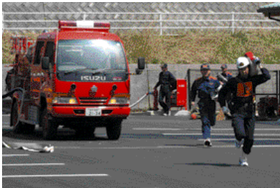
機敏な動きの中にも正確さが求められる