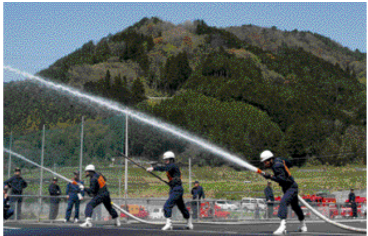
日々の訓練の成果を発揮