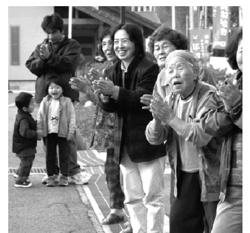
「がんばって」多くの人が沿道