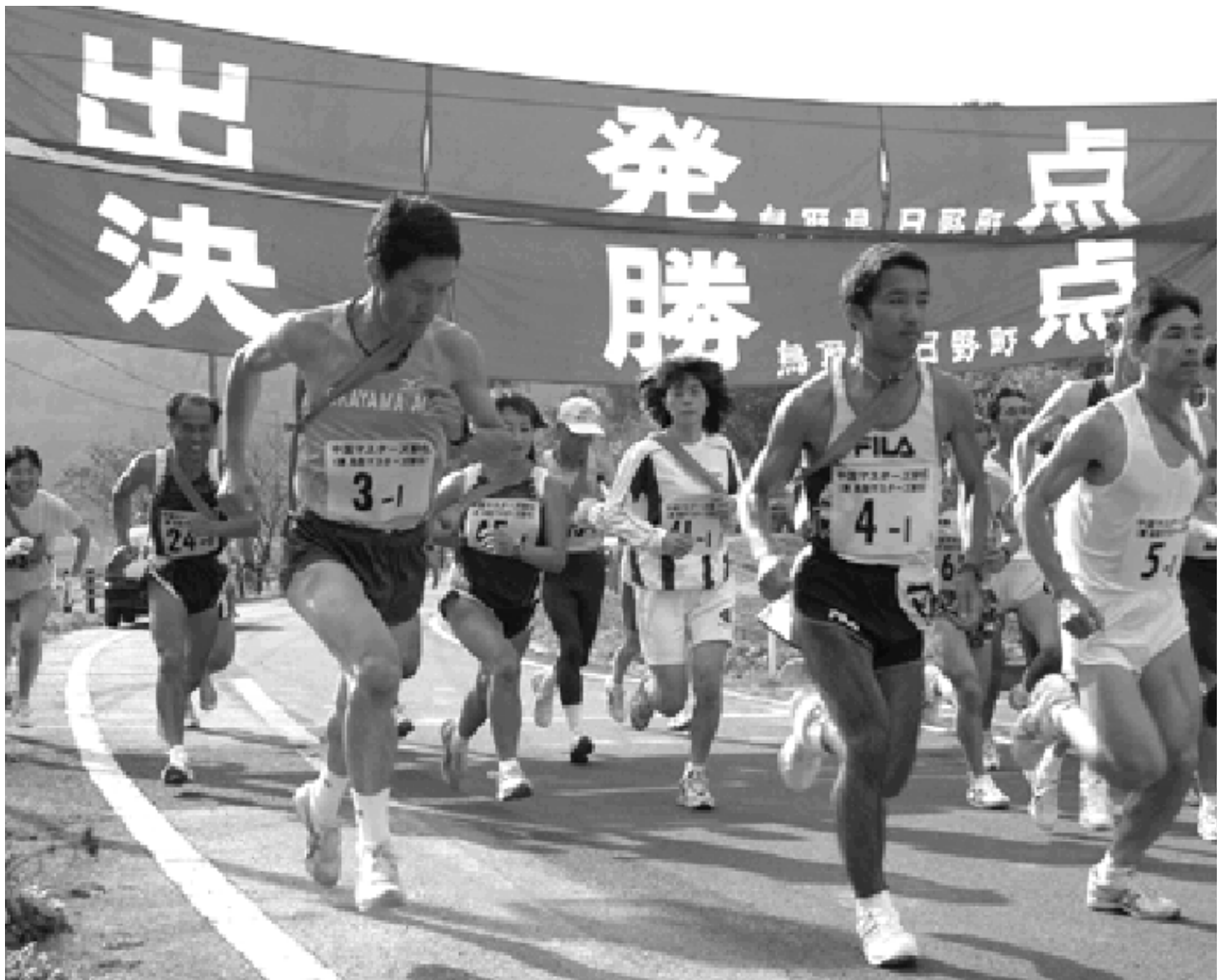
26チームが一斉にスタート。晩秋の日野路を走り抜ける