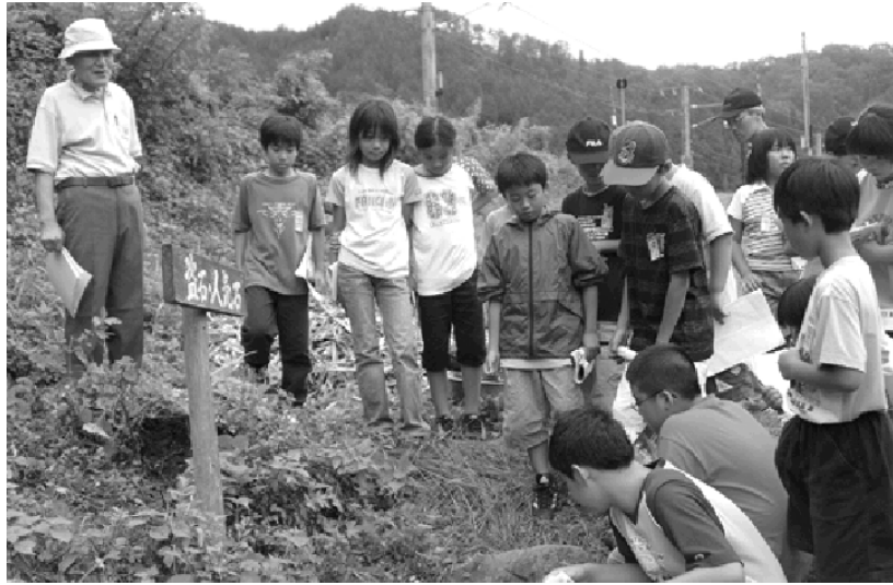
黒坂地区の文化遺産などを学ぶ小学生たち

初めて知る町の歴史がいっぱいありました。中でも因幡二十士の歴史が学べて良かったです。来年も楽しみです。