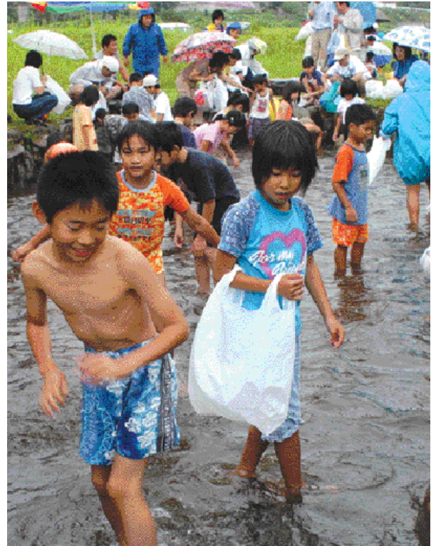
公園内の池でアユなどの魚を追いかける子どもたち

ふるさとに帰省した人たちなどに自然と触れ合ってもらおうと、8月14日、魚とのふれあい交流が、黒坂カワコふれあい公園で開かれました。お盆で帰省した人など約150人が参加。公園内にある池にアユ、ニジマス、ウナギ