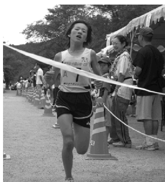
力を出し切り1位でゴール