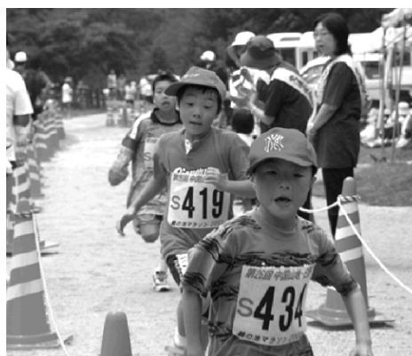
ゴール前の直線はラストスパート