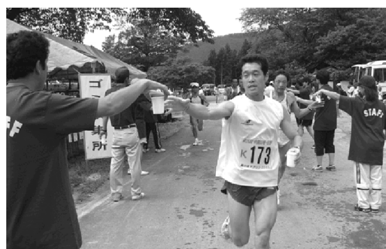
起伏の激しい6.9*コースには給水は欠かせない