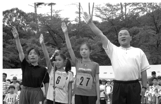
「さわやかな汗を流します」と家族4人で選手宣誓