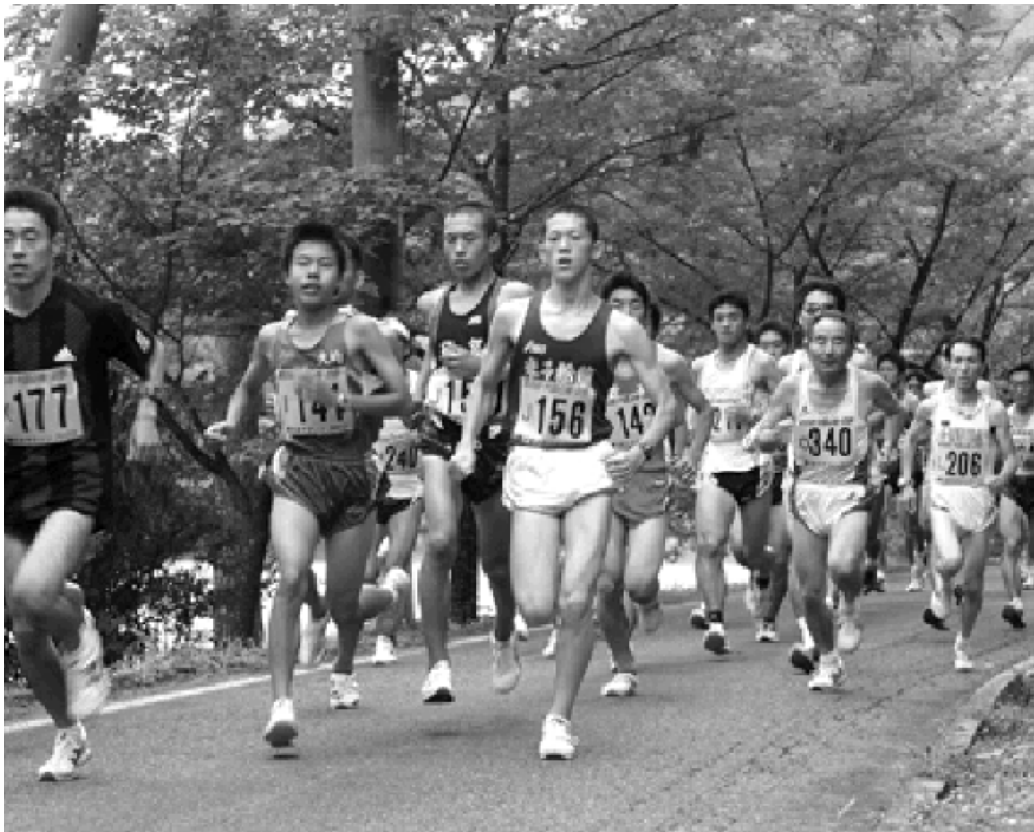
緑に囲まれた高原の鵜の池湖畔コースで500人が健脚を競う