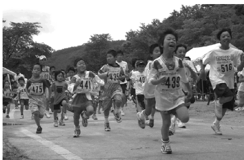
元気よくスタートする小学生たち