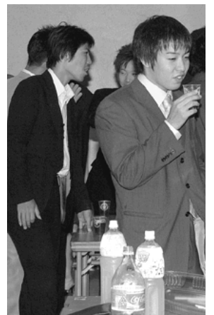
「みんな変わらないね」