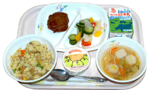
おいしいと好評の給食