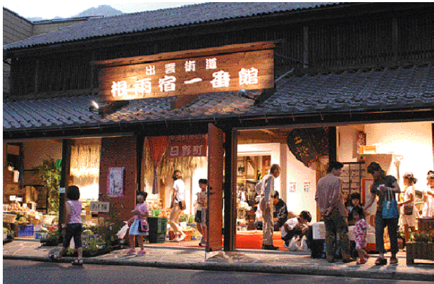
夏の風物詩となった土曜夜市には多くの人でにぎわう

夕暮れとともにライトアップ。6月14日から始まった夏恒例の出雲街道根雨宿一番館土曜夜市は、大勢の人々でにぎわっています。6月28日も根雨宿一番館や向かいの町商工会前駐車場には、特設