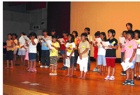
ホールに子どもたちの元気な声が響く

収穫祭の夜、子どもたちが星のおじい様との出会いを通して踊り広げられる物語。歌って、踊って、演じる見ごたえのあるミュージカルです。