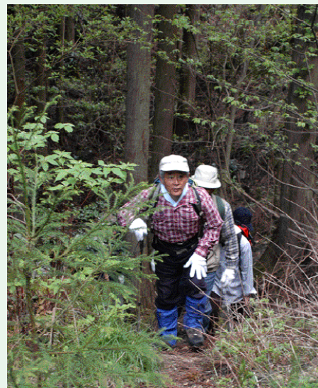
自然を楽しみながら山に登る参加者

どを観察。自分のペースで歩きながら、手付かずの自然と頂上の大パノラマを満喫していました。