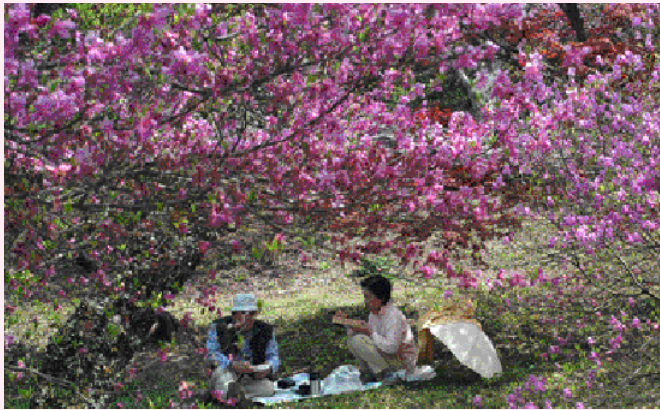
満開のツツジの下で昼食をとる花見客

桜・ツツジの名所で知られる奥日野県立自然公園「滝山公園」で、4月19日から5月5日まで、ツツジ祭りが開かれ、花見客でにぎわいました。公園内にある約3万本のダイセンミツバツツジの開花は、例年よ