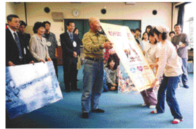
平成13年10月、オシドリグループ のメンバーたちが東京に行き、杉 並の子どもたちと交流を深めた。