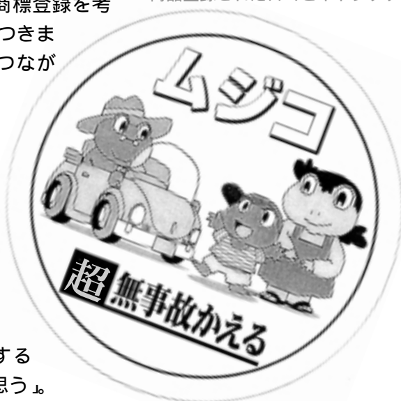
商品登録されたロゴとキャラクター

一人で悩まず、きちんと主 張していきましよう。 【連絡先】県立消費生活セン ター 西部消費生活相談室(米 子市末広町)、(電話085 9 34 2668・34 26 48)または、黒坂警察署(電 話74 0110)