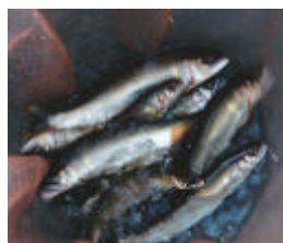
今年も元気な日野川のアユ

夏の風物詩、日野川のアユ漁が6月1日に解禁。県内外から多く釣り人たちが、竿を出しています。解禁日以降の釣果は今一つですが、アユ漁はこれから本番を迎えます。