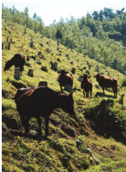
雄大な自然の中で、たくましく育つ牛たち

標高550mにある久住放牧場に、5月21日、黒毛和牛12頭が放牧されました。日野町は、昭和40年前半までは黒毛和牛の産地として知られていました。今では、飼育農家が34戸に減ってはいますが、良質の和牛を育てようと意欲的に取り組んでいます。牛たちは、10月末まで自然の中で育ち、ひと回り大きくなって、飼主の元へ帰って行きます。