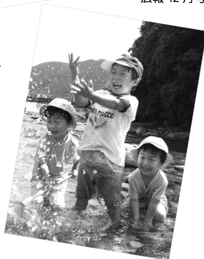
広報ひの8月号の表紙写真