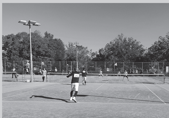
▲令和5年10月に行われた「ねんりんピック愛顔のえひめ2023」テニス交流大会

日野高等学校テニスコート（根雨）と日野町民テニスコート（野田）を会場に、ソフトテニス競技を実施します。