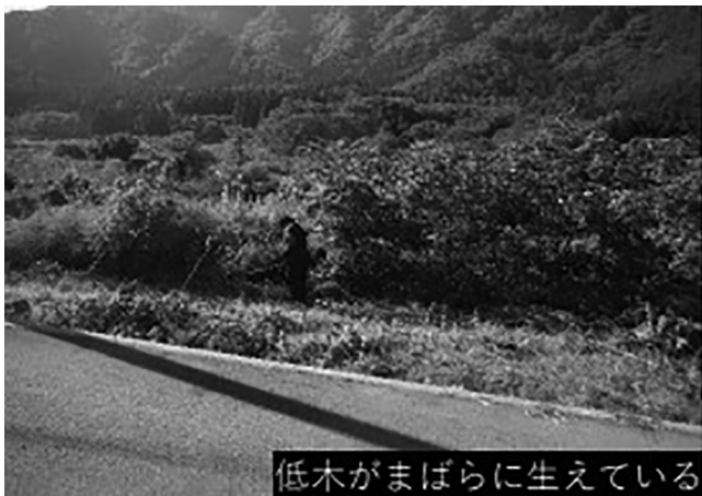
▲たった5年で再生困難な農地となり、隣接する農地へ悪影響が。

また、今年度からの新たな課題として、水田活用の直接支払交付金の見直しに係る「水張り5年ルール」（ページ左下参照）についても影響を把握するため、特に影響が大きいと思われるソバ圃場について、現地を見て思いを巡らせました。