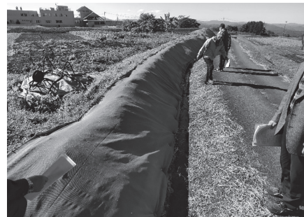
▲商品名「雑草抑制おまかせネット」

よくある防草シートとは違い、ネットの中で草が生きているため畦畔を崩さず、虫は通さないため、カメムシ被害も防げます。「石が多い畦畔」や「法面の下に水路などがあり、転落の危険がある畦畔」など、草刈りがしにくい畦畔ほど設置効果が高いようです。