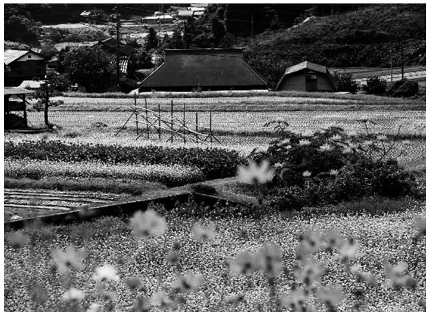
▲地域景観を形成する農地（ソバ）

農地パトロールでは、さまざまな理由により遊休化した農地を巡回し、圃場の状況、遊休化の原因、水路の状況などについて、現地を見て状況把握を行いました。比較的優良な農地であっても、飛び地であり水路管理を少人数で管理することが難しくなってきたため、遊休化が進んでいる農地が増加傾向にありました。