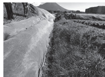
▲根は生かし、畦畔守り、草刈り不要