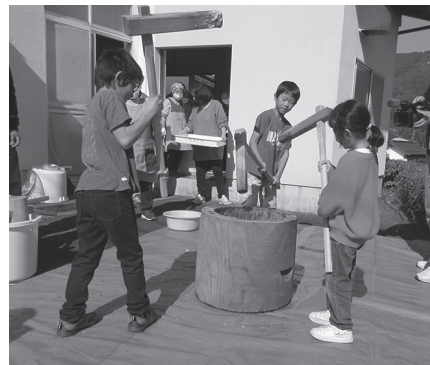
▲もちつきぺったん!

2日目の5日は、午前11時からもちつきが行われました。地区内の日野学園PTA、子どもたちが参加し、老若男女、活気に満ち溢れた歓声が飛び交っていました。出来たてのもちを器に入れて、来場者に配ると、「おいしい、おいしい!」とおかわりする人も。