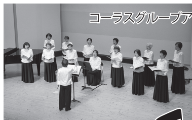
コーラスグループアザレア