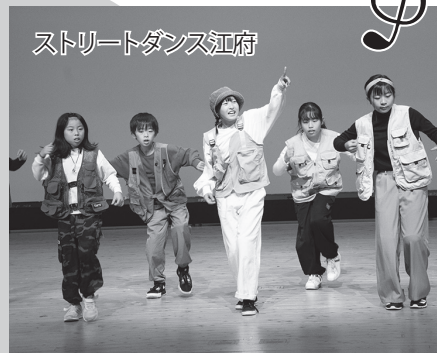
ストリートダンス江府