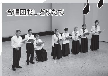
合唱団おしどりたち