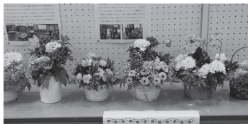
◀▼書道や写真、手芸品に工芸品など、地域の皆さんが制作した作品が数多く展示。日野学園や保育所、各種団体の日ごろの活動報告も展示されました。