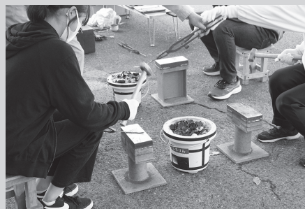
▶燃え上がる火に来場者もビックリ!? 砂鉄投入体験 ◀真っ赤に熱した鉄を打って鍛冶屋体験