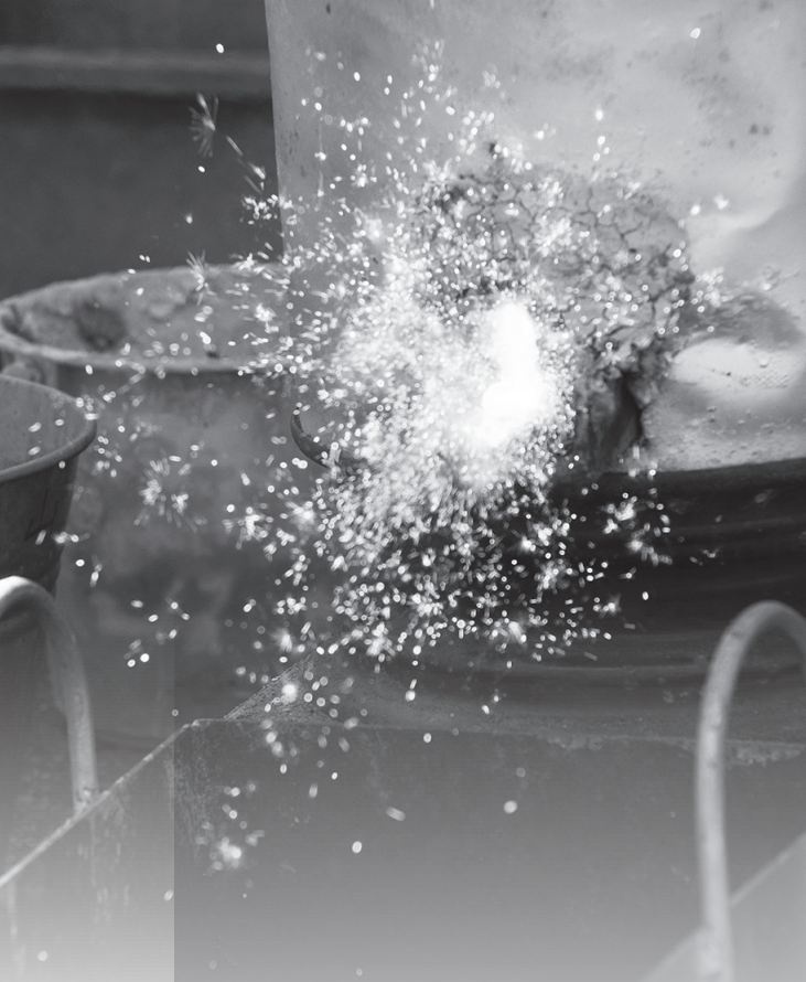
▲砂鉄を鉄に還元する際に出る不純物「ノロ」を排出する「ノロ出し」

会場では、「ミニたたら操業」が行われ、来場客は砂鉄の投入体験をするなど、たたら操業を疑似体験しました。また、会場では鍛冶工房宮光による、熱した鉄を打ってペーパーナイフなどを作る鍛冶屋体験や、都合山たたら AR 体験なども行われ、来場者はたたらの魅力を満喫していました。