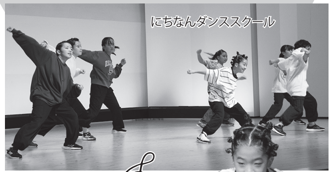
にちなんダンススクール