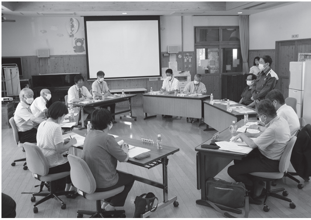
移動販売事業や黒坂のまちおこしについて語り合う