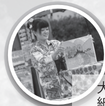
大道芸体験（皿回し）、紙芝居。イベントがたくさん！