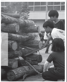
▲キャンプファイヤーへ火を入れます！