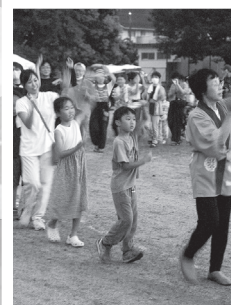
▲▶みんなで、レッツ！盆踊り♪