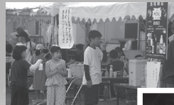
▶ビアガーデンが人気で大繁盛！