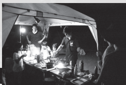
▼▶テントでキャンプ♪