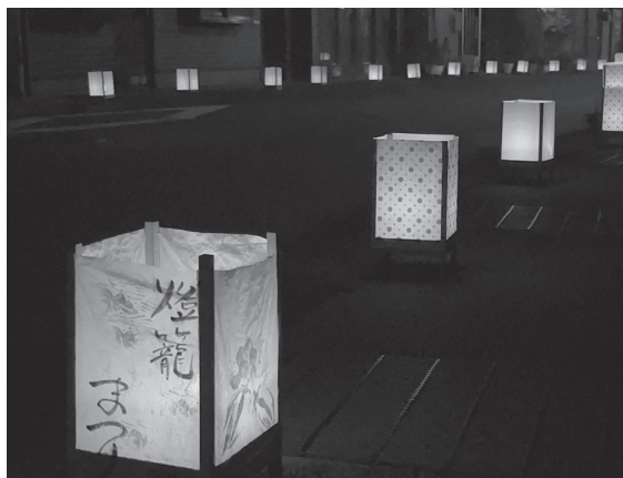
幻想的な燈籠の光がまちを照らし出す

9月1日、鳥取県庁で、「とっとり共生の森」森林保全・管理協定調印式が行われました。これは、株式会社ミヨシ産業（米子市）が、鵜の池湖畔の町有林で森林保全活動を開始することとなり、鳥取県と日野町でこの活動を支援するため、同社、鳥取県、日野町の三者間で協定を結んだものです。今後は、同社の協力のもと、下刈りや植栽などの森林保全活動を実施するとともに、社員研修やレクリエーション活動の場として、鵜の池公園キャンプ場を利用する予定です。