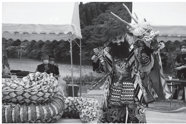
▲郷土芸能部による迫力ある演舞で会場を魅了

各クラス終了後には、日野高等学校郷土芸能部の皆さんによる公演「荒神神楽」が披露され、見事な演舞に会場からは大きな拍手が送られていました。