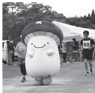
▲いたんも飛び入り参加！