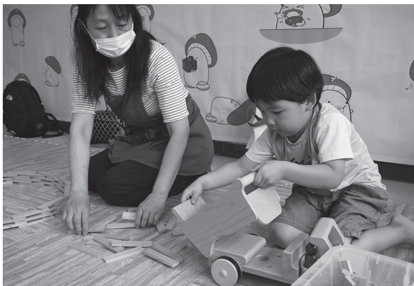
▲楽しそうなおもちゃに、子どもたちは夢中！