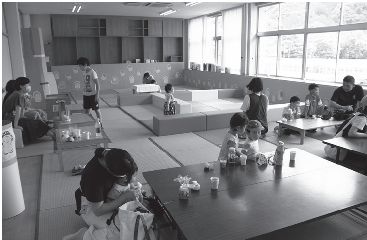
▲旧校長室（左）と旧職員室（右）を子どもが遊ぶスペースに改装

学校跡地を子どもたちの遊び場に しいたん広場オープニングイベント「しいたん広場であそぼ！」