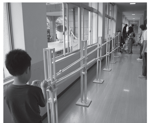
▲廊下には長い木のおもちゃも。

※木のおもちゃをつかった木育おもちゃの広場などは6月24日限りのイベントです。ご了承ください。