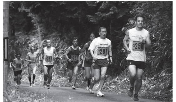
▶今大会の最高齢者！見事に走りきりました。