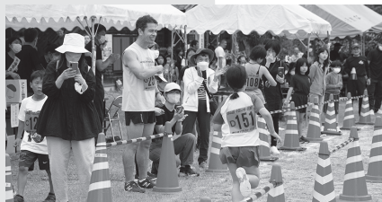
▼米子松陰高校の生徒も力走