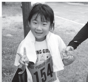
▲▶がんばって走ったね♪