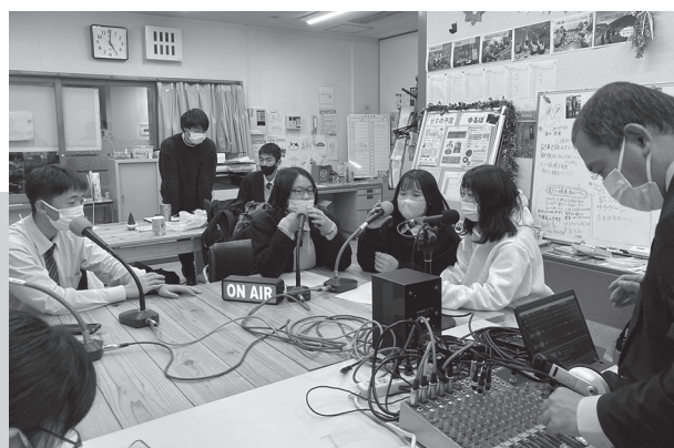
▲ラジオ局（DARAZ FM）の皆さんのおかげで、無事収録を終えることができました。