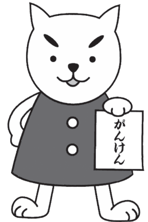
日野町がん予防キャラクター 「がんけん」