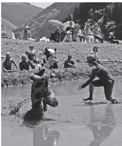
▲泥んこベースボールサッカー

津地自治会は、公民館活動が活発です。地区大運動会は、昭和57年から始まり、田植えを終えた日曜日に、住民総出で親睦を深めています。若者から高齢者まで住民のまとまりが良く、銭太鼓グループやソフトボール同好会、老人クラブによるゲートボール同好会など