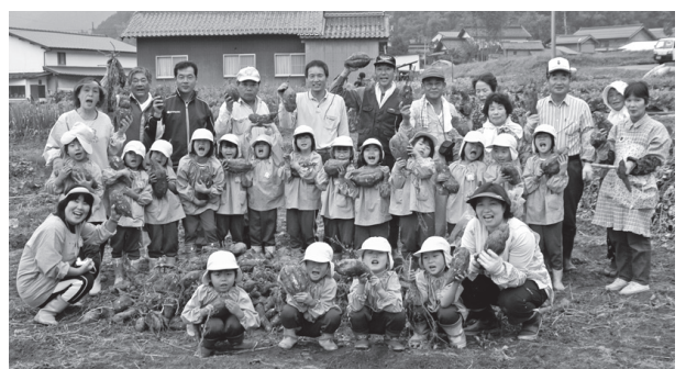
▲ひのっこ保育所園児を迎え、イモ掘り交流

以前から津地公会堂を活動の拠点としており、平成15年には新たに「津地自治会館」を整備しました。住民は時となく集まり、本音で話し合うとともに、チャ