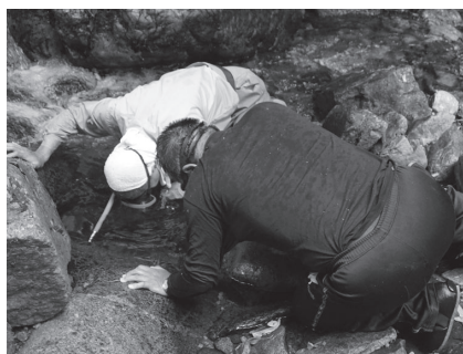
▲カジカらしき魚を発見か？

しばらく歩くと滝があり、それ以上進めないで、調査は終了。小さな谷川に生息するというナガレホトケドジョウを見つ