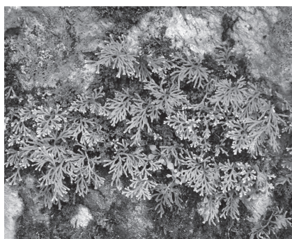
▲朝刈川左岸に生育していたカタヒバ