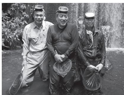
▲調査を終えひと息