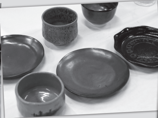
地域で活躍する団体や個人が日ごろの活動の成果を発表