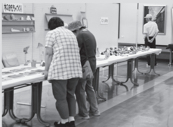
作品を夢中で見つめる来場者

見事な墨彩画や書のほか、絵画、写真、ちぎり絵、木のおもちゃ、パッチワークなどの力作・大作が会場いっぱい展示され、来場者は夢中で眺めていました。