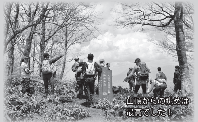
山頂からの眺めは最高でした！

当日は主に米子方面から、計15名の参加者がいました。新緑の美しい季節になり、爽やかな山歩きを楽しむことができました。宝仏山は何より