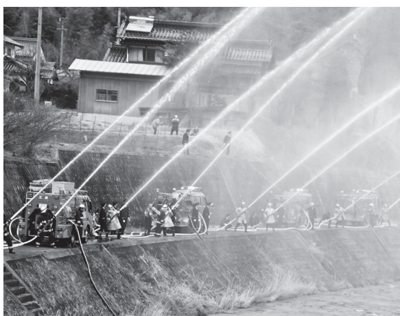
一斉放水を行う町消防団