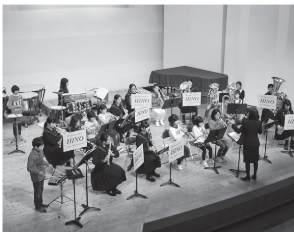
根雨小金管バンドとの合同演奏。元気な音色が響く

日野中学校吹奏楽部が、地域の人や保護者への日ごろの感謝の気持ちを込め、3月20日、町文化センターで、「桜薫るコンサート」を開きました。このコンサートは、卒業を迎えた3年生と部員らとの最後のステージとして毎年行われています。