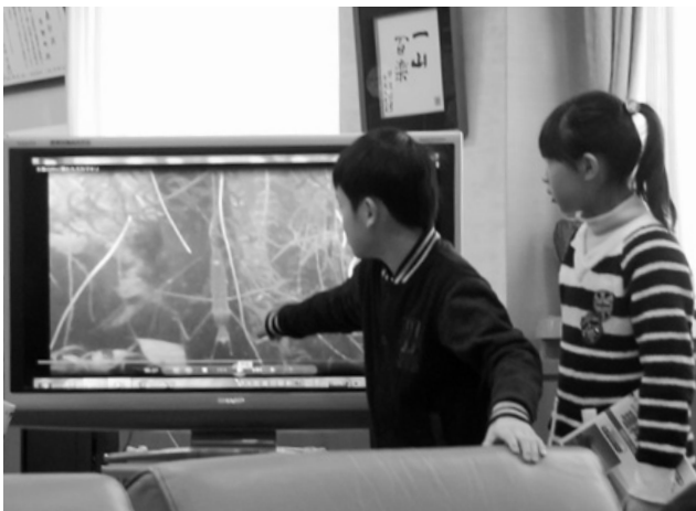
水中カメラでとらえたビオトープ内の様子を紹介