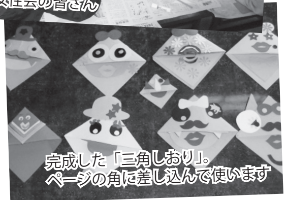
完成した「三角しおり」。 ページの角に差し込んで使います