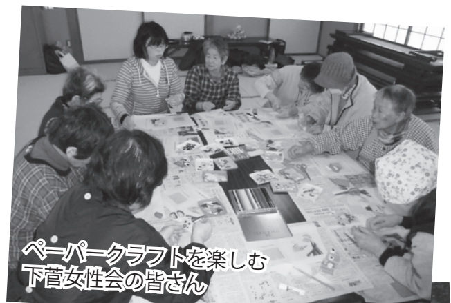
ペーパークラフトを楽しむ 下菅女性会の皆さん