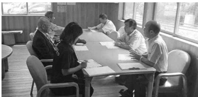
執行部との意見交換