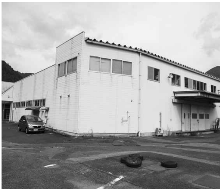
セレモニーゾーンに活用される部分の元日野サンプラザ