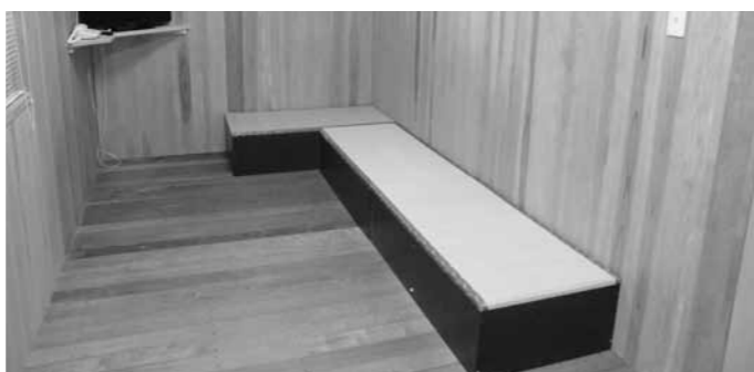
区分された「発熱外来待合室」

日野病院発熱外来棟を一部改装した「病後児保育施設」が8月末に完成したことから、9月26日この施設を視察しました。