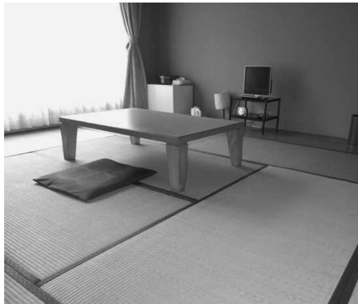
和室10畳では宿泊客のニーズに合わない