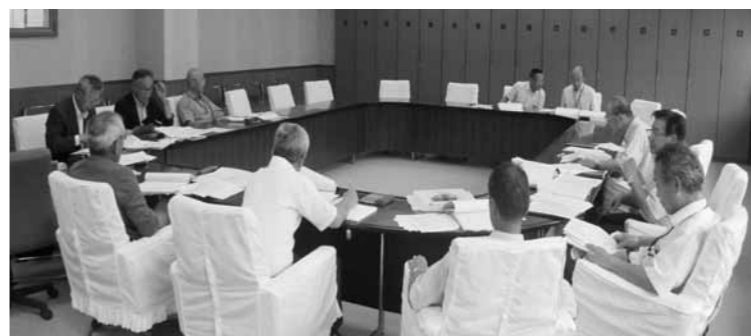
決算審査特別委員会