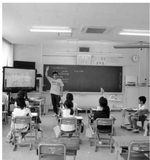
タブレット使用・活発な意見交換（根雨小学校）

先生から問題が出され、問題と解く考え方や式、答えを自分のノートに書きまします。次にタブレットの写真を写し、先生の電子黒板に送ります。その手さばき、指さばきはタブレットを使いこなしていると感じました。先生は、ノートの内容を電子黒板に映し出し、子供の考え方の違いや単位の付け方等学ばせていました。