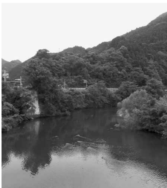
野田橋から見る塔の峰公園

高校において、来年度からの寮の再開に向け、必要な施設や設備の改修等も含め検討が進められています。 日野高校には、検討された結果、高校だけでは対応できない事項があれば、町に相談いただきたいと話しています。町として支援が必要な状況であれば、来年度当初予算で提案させていただきますか。