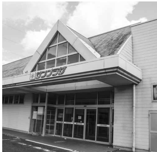
元日野サンプラザ

元日野サンプラザ活用特別委員会は、議員全員で構成し、9月議会開催中に4回開催しました。委員会は以下のことについて執行部に説明をもとめました。