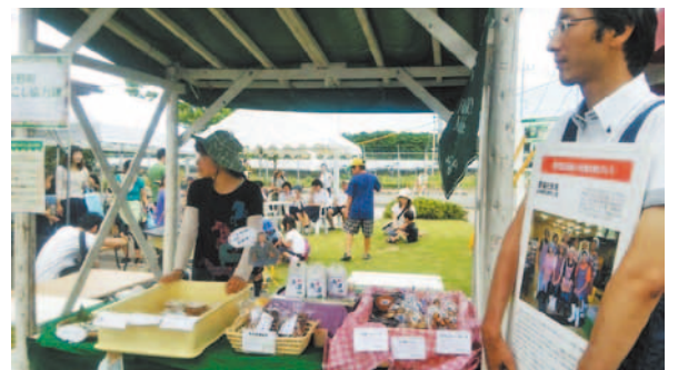
町の特産商品をイベントなどで紹介販売

人口減少や高齢化等の進捗が著しい地方において、地域の力の維持や強化を図るため外の人材を積極的に呼び込もうとするものです。全国の市や町の自治体が募集を行なっており、日野町は高齢者の生活支援や農業支援、特産品の開発、産品ピーアールなどを行う人材