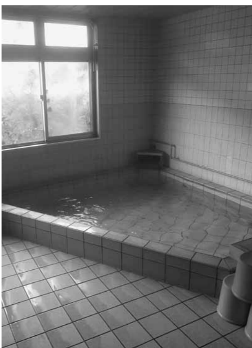
日帰り入浴だけの利用もできます

町長 大きく言えば①集客努力の不足②施設、特に客室がニーズに合っていない③町の踏み込んだサポートが必要である、と認識します。