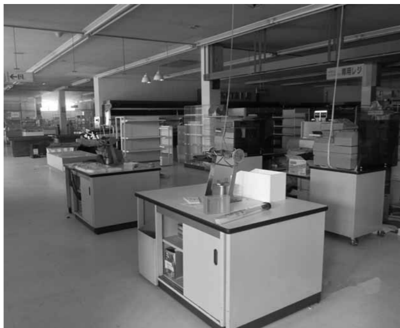
撤去前の内部の様子

方向性についての説明があり、事業の特殊性を鑑み専門業者に委託運営したいとの報告をうけました。