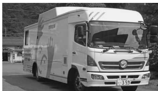
住民の健康を守る検診