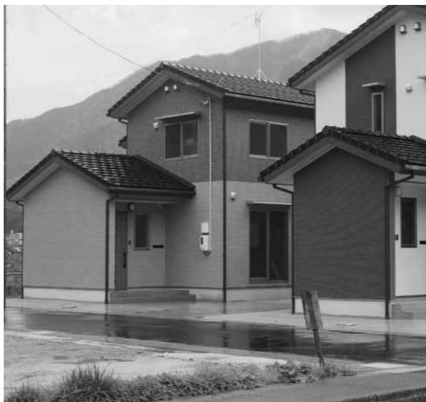
野田の世帯向住宅

町長 公営住宅法により、入居者が譲り受けを希望し耐用年数の4分の1を経過した場合においては、国の承認を得て、払い下げができることになっていきます。入居者の払い下げの希望があれば検討してみたいと考えています。