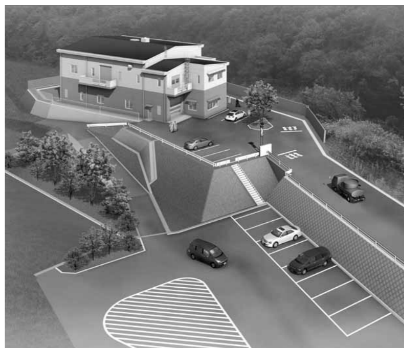
「新・清化園」完成予想図（場所・江府町佐川）