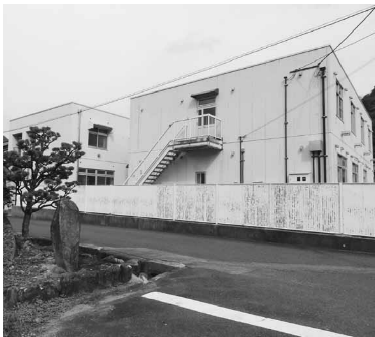
現在の日野高校宿舎