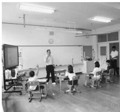
ICT活用授業・みんな元気に挙手（黒坂小学校）

全員にタブレットを持たせての授業は、小規模校ならではのメリットです。児童の理解度が先生に伝わり