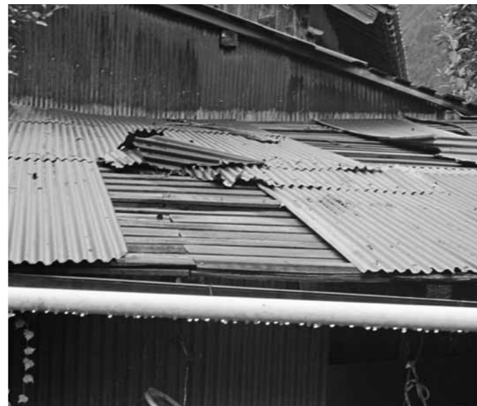
危険な状態となっている空き家

議員 町内において、町部、山間部問わず倒壊の危険がある建物が見られるようになりました。今すぐにも処置を講じなければならぬような物件があると私は認識をしています。町がこの問題に対して責任を果たしていく必要があると考えます。今現在、町内に倒壊のおそれのある建物が何件あると把握し、所有者に対してどのような行政指導を行っているのか。また、日