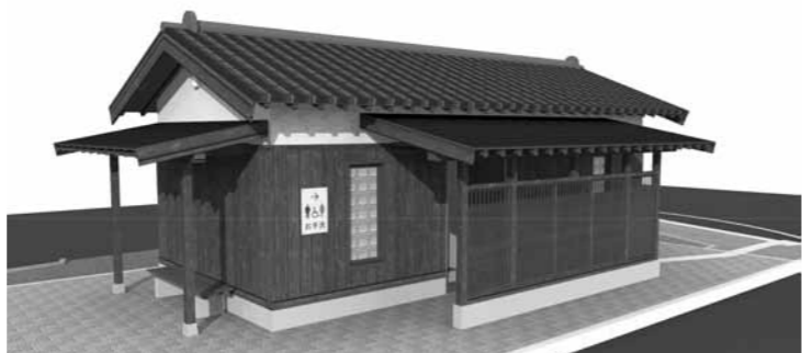
根雨駅前公衆トイレ完成予想図