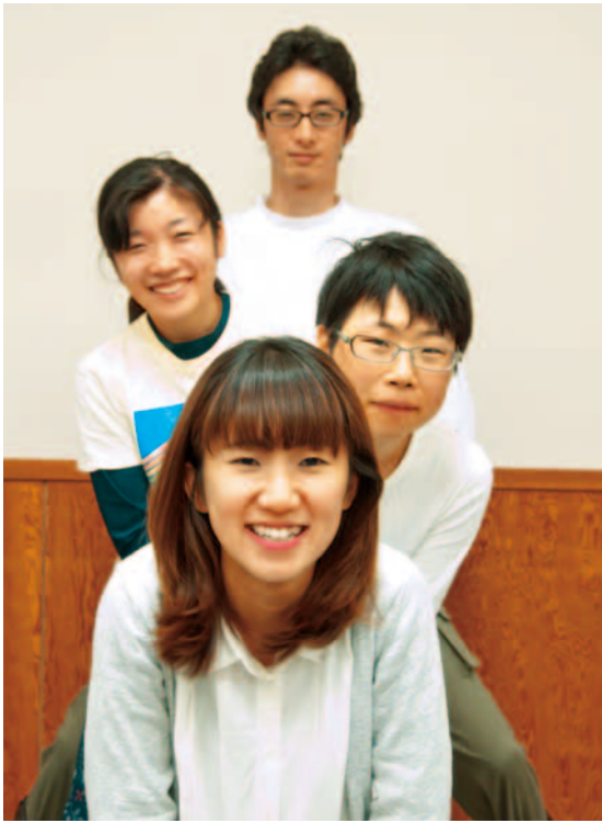
地域おこし協力隊メンバーです