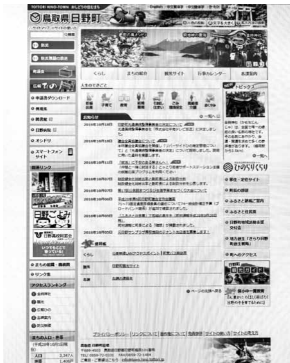
日野町のホームページ

町長 史跡指定すると、制限があり、審議会に諮り、十分審議をさせていただきたいと思