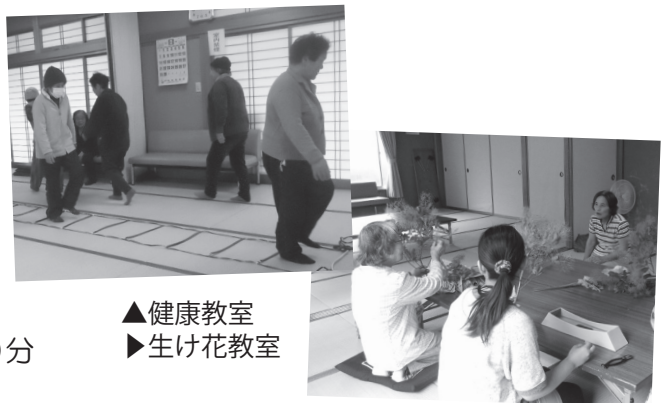
▲健康教室 ▶生け花教室

このほか、手芸教室、クレイフラワー教室、料理教室などを開催予定です。詳しくは、隣保館だより、または、防災無線でお知らせします。ふるってご参加ください。なお、参加希望など、詳しくは、下榎隣保館（電話72-1191）までご連絡ください。