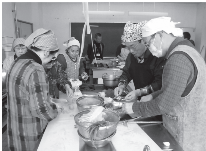
みんなで協力しながらジビエを調理

料理の完成後は、参加者全員で料理の出来具合や味について話しながら食事を楽しみました。「とてもおいしい」「うまくできて良かった」といった声があがり、ジビ