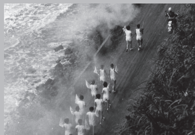
東京五輪聖火リレーに参加 (名和町にて)

①日野町および旧町村に関する写真 (明治から昭和の建物や地域の風景、祭り、行事など)