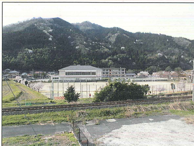
日野中学校まで徒歩5分