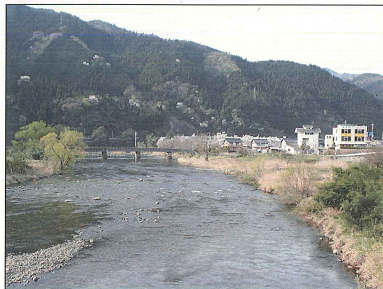
日野川 徒歩圏内 秋～春にかけて約1,000羽のオシドリが飛来します