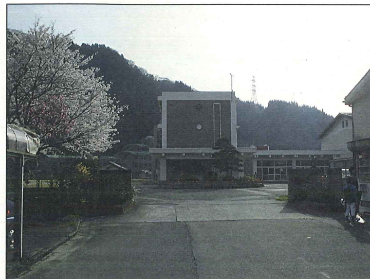
根雨小学校まで徒歩5分