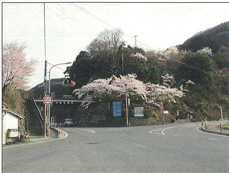
塔の峰公園 徒歩圏内