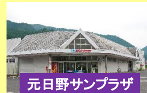
元日野サンプラザ