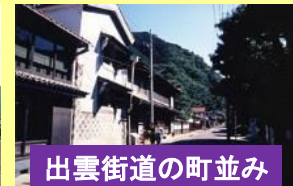
出雲街道の町並み