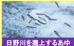
日野川を遡上するあゆ