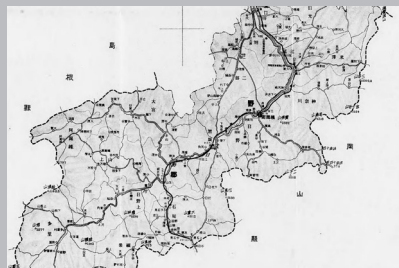
日野郡地図（大正15年、日野郡史）