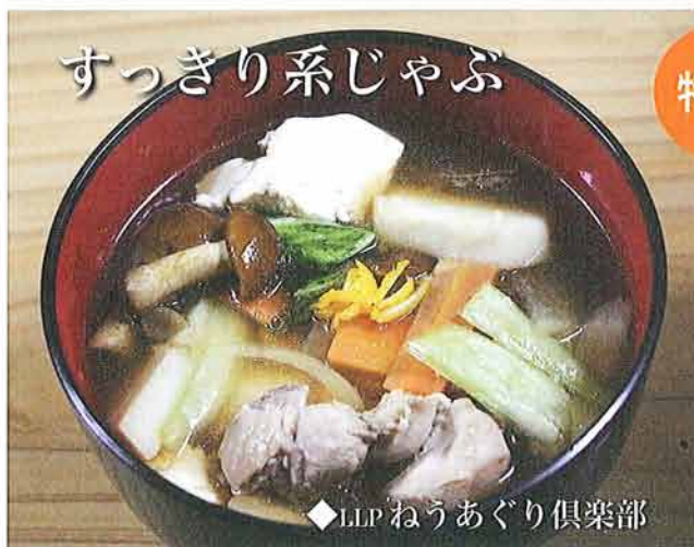
◆LLPねうあぐり倶楽部

シンプルな生姜風味のしょうゆ味 なので、根菜の旨みが引き立つ！ 里芋、なめ茸のぬめりで喉ごしよく 柚子の風味が食欲をうながす。