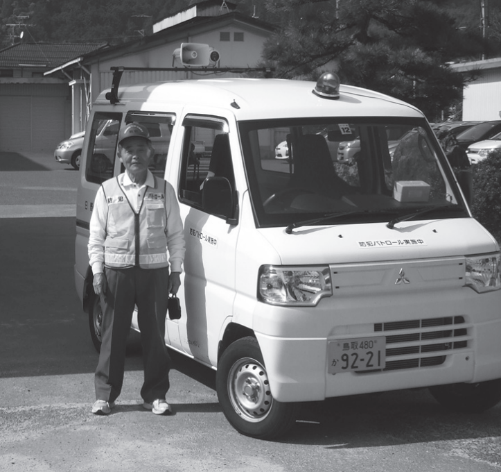
▲地域の安全を見守る青パト車