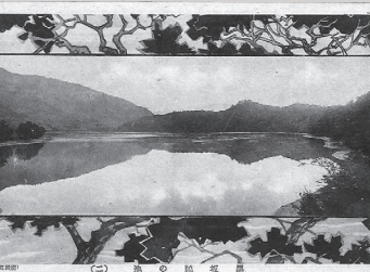
鵜の池の絵はがき (昭和初期)

町では、今後刊行予定の「日野町史(仮)」の編さんにあたり、まちのあゆみ・歴史を物語る写真や資料などを収集しています。次のような資料をお持ちの方はご連絡ください。