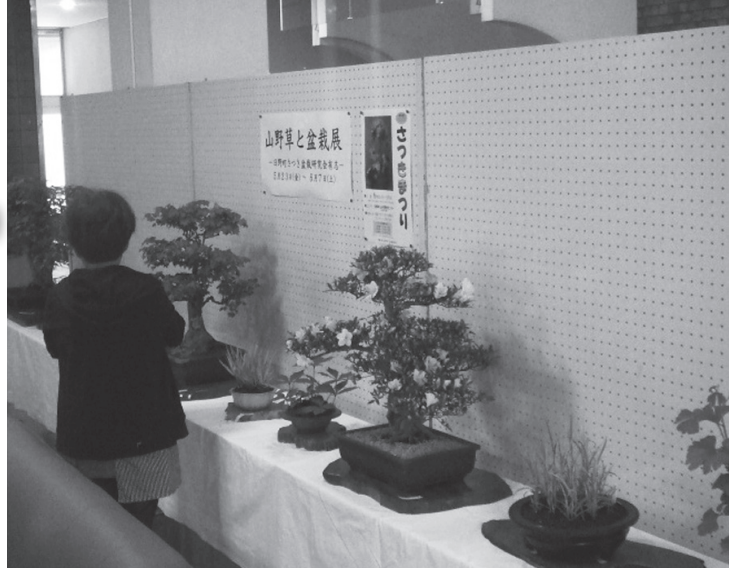
▲6月7日まで開催した山野草と盆栽展の様子

公民館ではロビーでは、皆さんの自慢の作品を募集、展示しています。絵画、写真、書道作品などの作品を展示してみませんか？この機会にぜひ、ご活用ください。