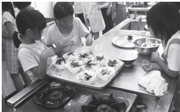
▲ 昨年の様子 (食事も自分たちで作ります)