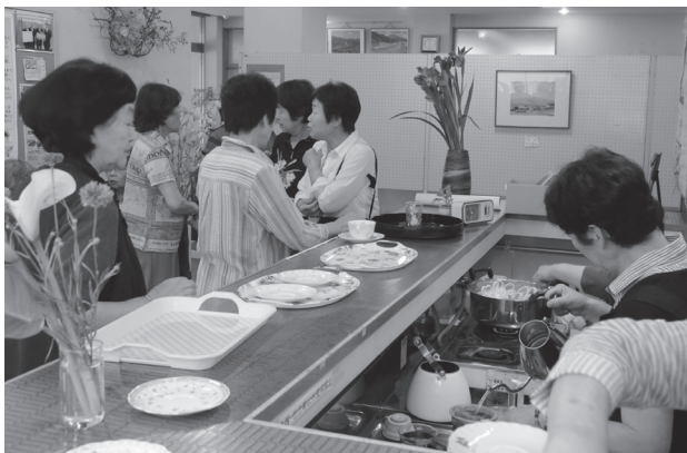
講演終了後は大にぎわいでスタッフも大忙し

講演後は、カフェでコーヒーが振る舞われ、出席者らは和気あいあいと会話を楽しみながら、コーヒーの味や香り、そして雰囲気味わっていました。