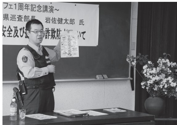
何かおかしいと思ったら、すぐに相談を

昨年、町公民館にオープンしたおしゃべりカフェが、6月2日でオープン1周年を迎えたのを記念して、6月1日、町公民館でおしゃべりカフェ1周年記念行事が開催されました。